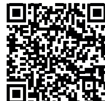
Google Play Store (Android)